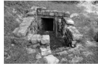
Die Quelle heute

Frau Zoppi bittet sie herein, doch sie wollen sich zunächst waschen, da sie schmutzig sind. Tochter Marinella führt die Soldaten zur nahen Quelle, an der sie sich waschen können.