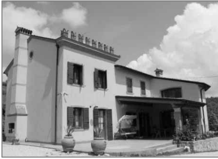
Ort des Geschehens: Haus in Tregnago