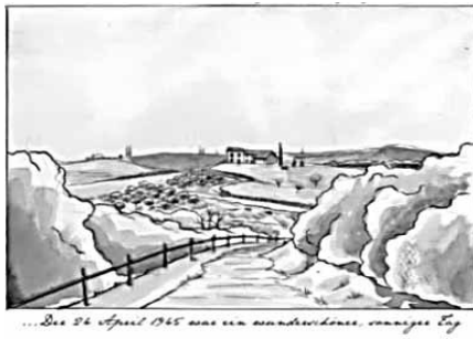
... Der 24. April 1945 war ein sonderbarer, verringer Tag

Am 9. April 1945 begann dann die Schlussoffensive der Alliierten in Italien. Doch die deutschen Truppen ergaben sich nur nach schweren Gefechten. Sie hatten Befehl, die Stellungen zu halten. Am 17. April 1945 starteten die Amerikaner einen Großangriff von Bologna aus. Am 20. April waren die Truppen bis zum Fluss Po gekommen und danach war die Gotische Linie überwunden. Die deutschen Truppen konnten keinen geordneten Rückzug mehr antreten. Zurückgebliebene deutsche Soldaten versuchten wieder Anschluss an Truppenteile zu finden, doch ihr Rückzug wurde durch die Partisanenangriffe erschwert.